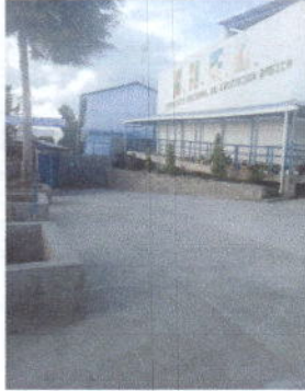
Foto1: Sustitución de piso de concreto